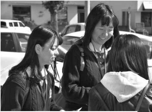
▲「高校生ボランティアだるま」の皆様