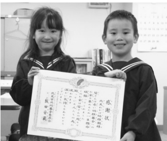
▲「わかば幼稚園」の園児の皆様

「歳末たすけあい募金」は、市内で支援を必要とする世帯への見舞金や、福祉団体等が行う歳末事業に活用されました。（なお、一部は翌年度事業への助成として活用されます。）