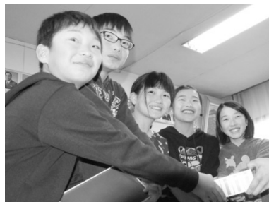
▲「東小学校」の生徒会の皆様