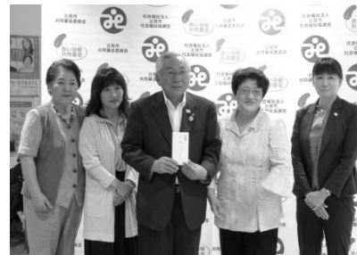
▲「小さな親切運動北見支部」の皆様

募金実績は現在集計中のため、次号の「社協だより」にてご報告させていただきます。 募金運動・災害義援金に関するお問合せ等は、共同募金委員会事務局が担当しています。 北見市社会福祉協議会の本所・各支所（P 8）までご連絡願います。