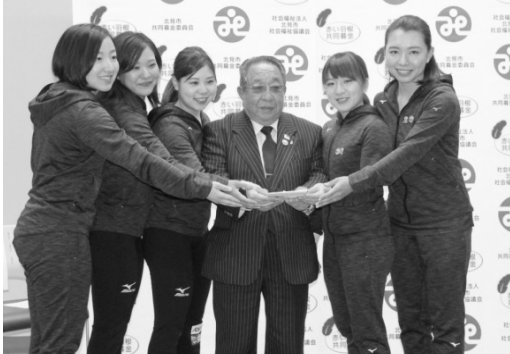
▲女子カーリングチーム「ロコソラーレ」の皆様