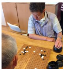
囲碁ボランティアの様子