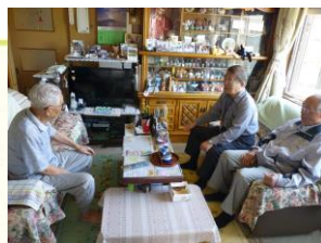
お話し相手ボランティアの様子

在宅や施設の高齢者の話し相手、市内施設等でのつくりもの、囲碁・麻雀ボランティア、買い物支援、水泳指導、リフトバス介助ボランティア、視覚障がい者の歩行ガイド、独居高齢者宅の窓ふき、除雪、生け花、施設喫茶店の補助など。