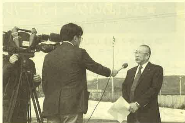
▲当日取材を受ける蛸子さんの様子