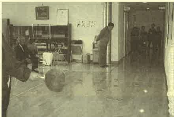
▲6/15 豊北長寿クラブ例会の様子

「カーリンコン」とは、国民的な人気となっているカーリングに似ているゲームで、年齢を問わず、体の不自由な方々とも幅広い交流が可能なニュースポーツです。