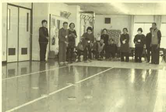
▲三区喜楽会：カーリンコンの様子

会員になられていない方は、新年度からは是非加入して下さい！きっと貴方の役に立つはずですよ。 (各単位クラブでは、会員を随時募集中！！)