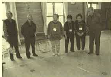
▲左上：協和協寿会・左下：端野中央寿クラブ ▲右：二区屯田クラブ