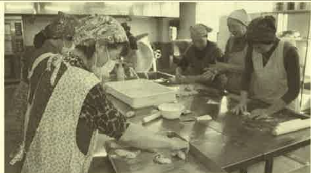
▲パンづくりの様子

平成16年から毎年行っている恒例事業となっており、今年度もお届けした先では「とても嬉しい」と大変喜ばれました。