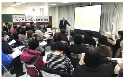
▲熱心に耳を傾ける参加者

令和2年2月18日(火)、北見市常呂町公民館において「常呂町民のための“老いをより良く生きる”講座を開催しました。「不動産相続」「成年後見制度」をテーマとした本講座では、40名の方が参加され、安心した老後の備えなどについて知識を深める時間となりました。