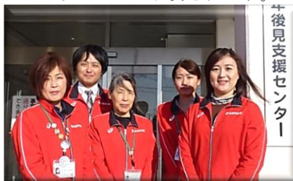
▲北見市成年後見支援センター職員

当センターで対応する成年後見制度に関する相談件数は年々増加していますが、その中には、現時点では制度利用には至らないまでも、将来的に利用が必要と考えられるケースも少なくなく、早期に専門職や関係機関が関わりを持つことで、適切な時期を相談しながら制度を利用することも出来ると考えられます。