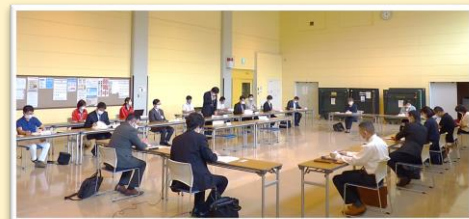
▲北見市成年後見支援センター運営委員会の様子

今期より、北見赤十字病院様、精神保健福祉士協会様の2団体には両委員会に、また、オブザーバとして釧路家庭裁判所北見支部様、北海道オホーツク総合振興局様にも参画いただけることとなりました。今年度の運営委員会・審査検討会は、延べ7回の開催を予定しています。