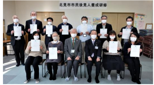
▲第5期 養成研修を修了された皆様（1名欠席）

新型コロナウイルス感染症への対応に日々変化を求められる大変な状況下にもかかわらず、快くご協力いただいた講師の方々に、事務局一同、心より感謝を申し上げます。