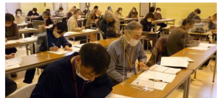
▲熱心に耳を傾ける参加者

また、感染症対策に十分配慮したなかで短時間のペアワークもを行い、アンケートでは「“体感したことがある”ということが今後の活動にとっても役立つと実感しました」「改めて認知症の人の気持ちが、ほんの少し理解できました」「根気よく、優しく対応する事が重要なことだと思いました」などの感想が寄せられました。