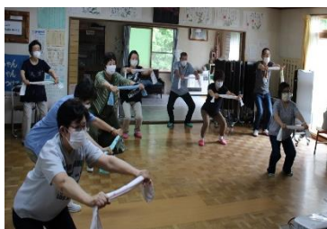
きたみんと体操の様子