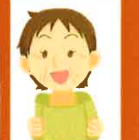
お手伝いできる 有志の方

今年度から北見市社会福祉協議会で行う「地域支え合い事業（互近助サービス）」が開始となります。サービスの対象（利用会員）となるのは、概ね65歳以上の日常生活に支障がある方です。