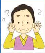
ちょっとした こまり事がある

『地域支え合い事業（ ごきんじょ 互近助サービス）』が常呂地区でも実施されます。