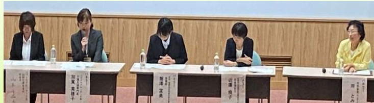
▲パネルディスカッションの様子