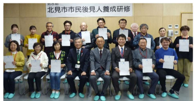
▲第8期 養成研修を修了された皆様（1名欠席）

令和5年8月20日(日)より全6日間、延べ1800時間にわたり開講した養成研修の実施にあたっては、多くの関係者や関係機関の皆様を支えられ無事、修了することができました。事務局員一同、心より感謝申し上げます。