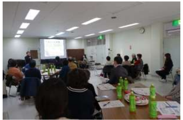
↑20名の市民の方に参加していただきました

2025年問題を迎えた現状の課題や全国の事例紹介の他、10年後、20年後も住み慣れた常呂で安心して暮らしていくためには何が必要かなど、参加者との意見交換を交えながらお話ししていただきました。