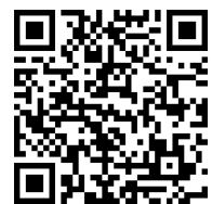
この講座の様子は、北見市役所介護福祉課公式ユーチューブチャンネルで配信予定です。