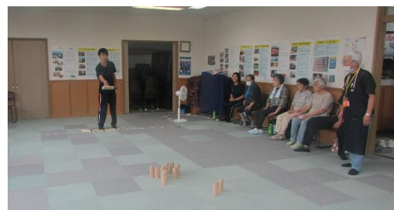
↑前回の作業後にモルックで交流