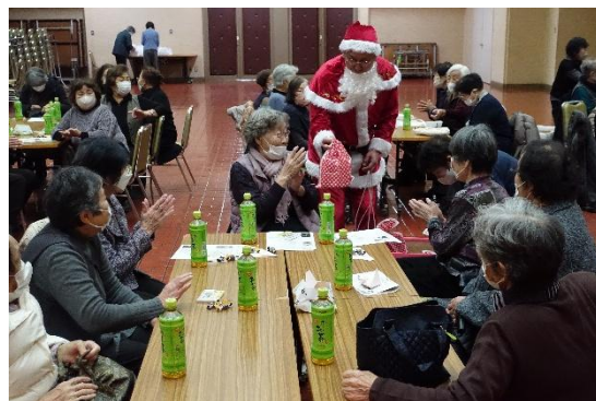
▲今年も「社協サンタ」は来てくれるかな？