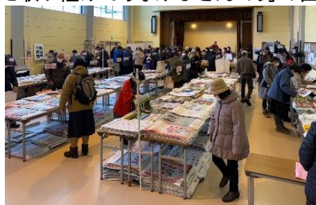
↑昨年のカレンダーリサイクル市の様子

カレンダーリサイクル実行委員会(後援:北見市社会福祉協議会)は家庭や企業から余剰在庫となった未使用カレンダーを募り、販売することで得た収益金を地域福祉に役立てたいという思いから市民有志が始めた取り組みです。みなさんの身の回りに不要なカレン