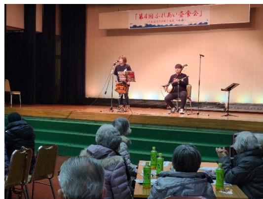
▲昨年は民謡演奏を楽しみました。