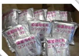
災害ボランティアセンター資機材の整備