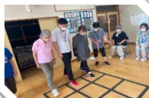
福祉活動を行う団体への助成