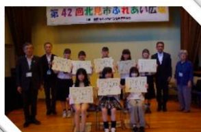
児童・福祉作文コンクールの実施

共同募金運動の全国共通テーマとして、皆さまからいただいた募金を『つながりをたやさない』ための地域福祉事業に配分しています。