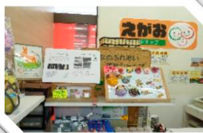
福祉ショップえがおの運営