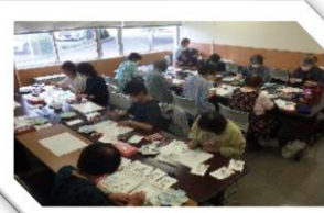
ボランティアによる暑中見舞い・年賀状作成