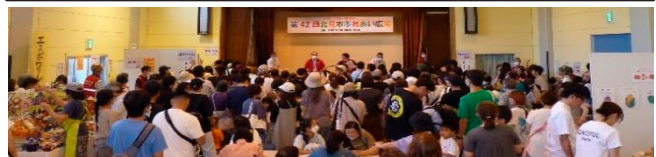
▲ ふれあい広場の様子