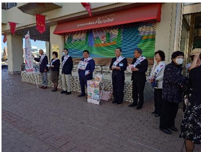
〈街頭募金活動の様子〉